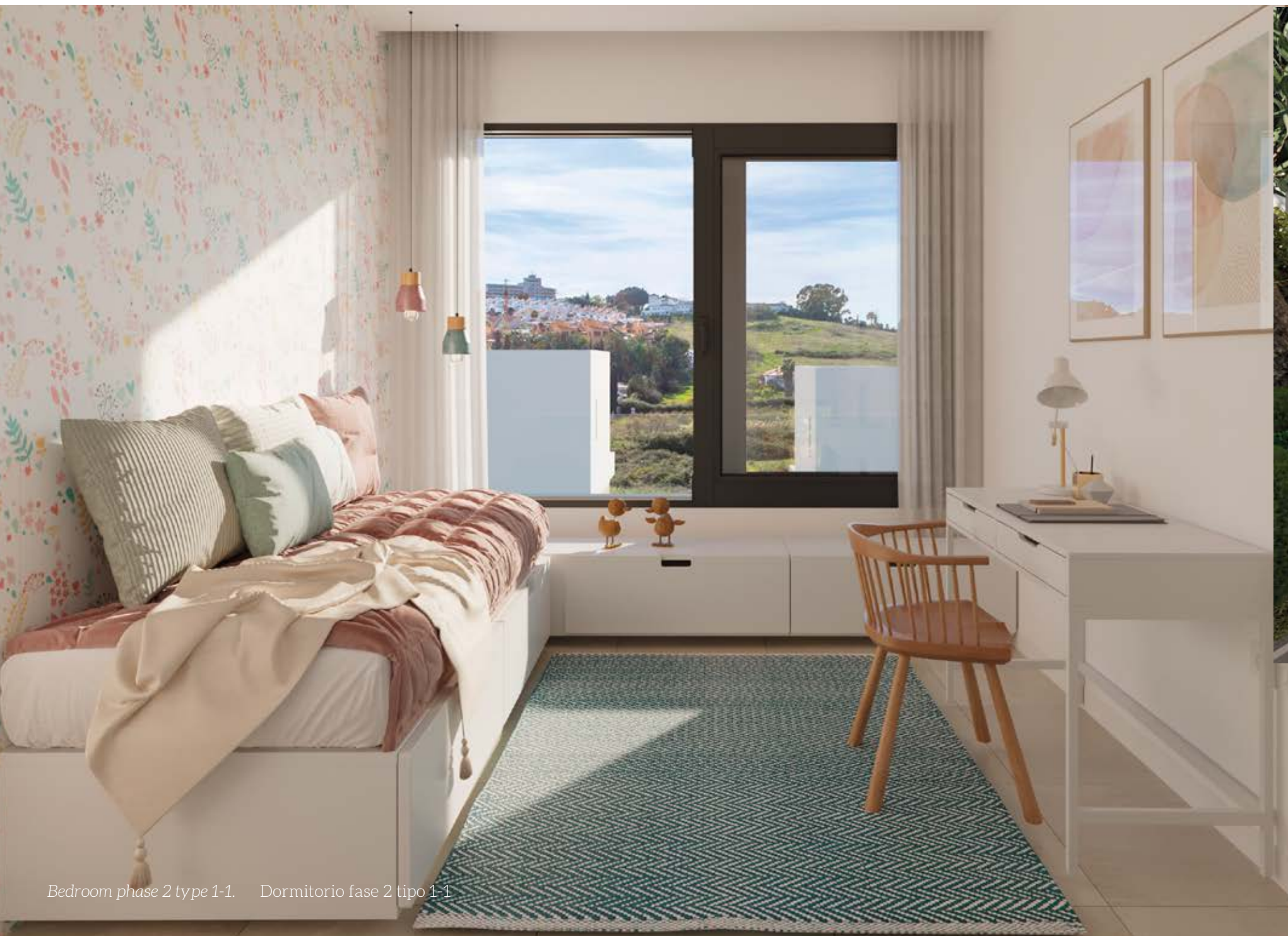
Bedroom phase 2 type 1-1. Dormitorio fase 2 tipo 1-1