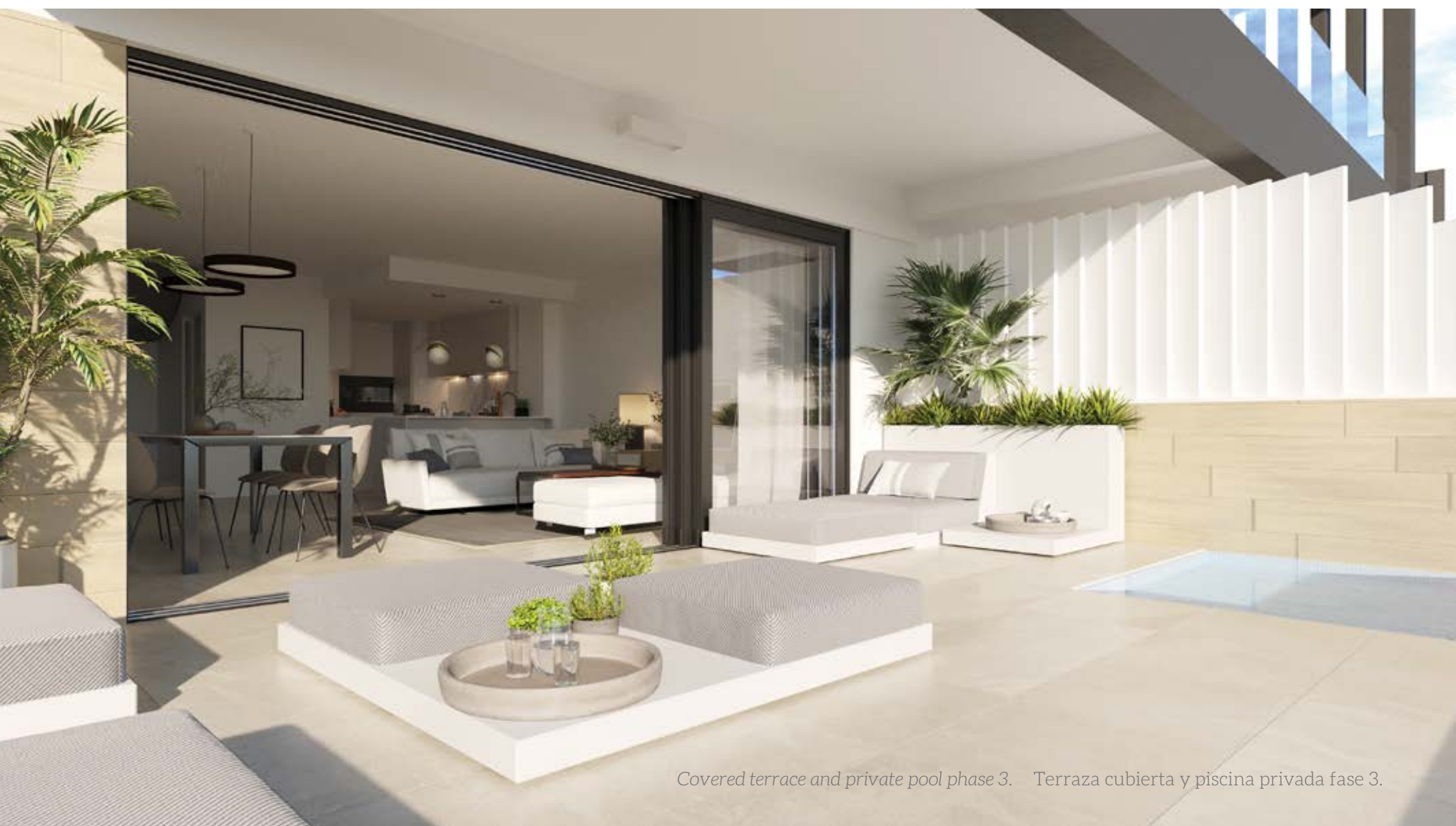
Covered terrace and private pool phase 3. Terraza cubierta y piscina privada fase 3.