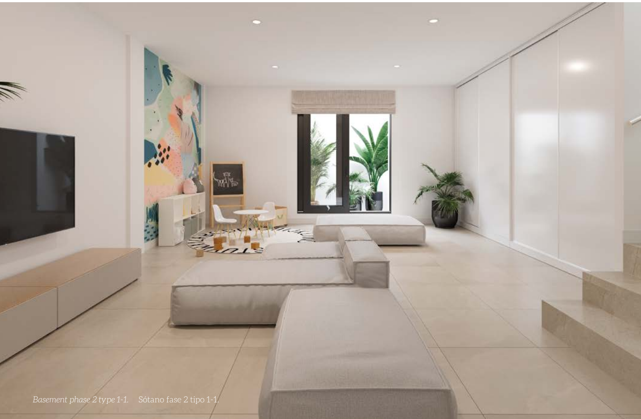
Basement phase 2 type 1-1. Sótano fase 2 tipo 1-1.