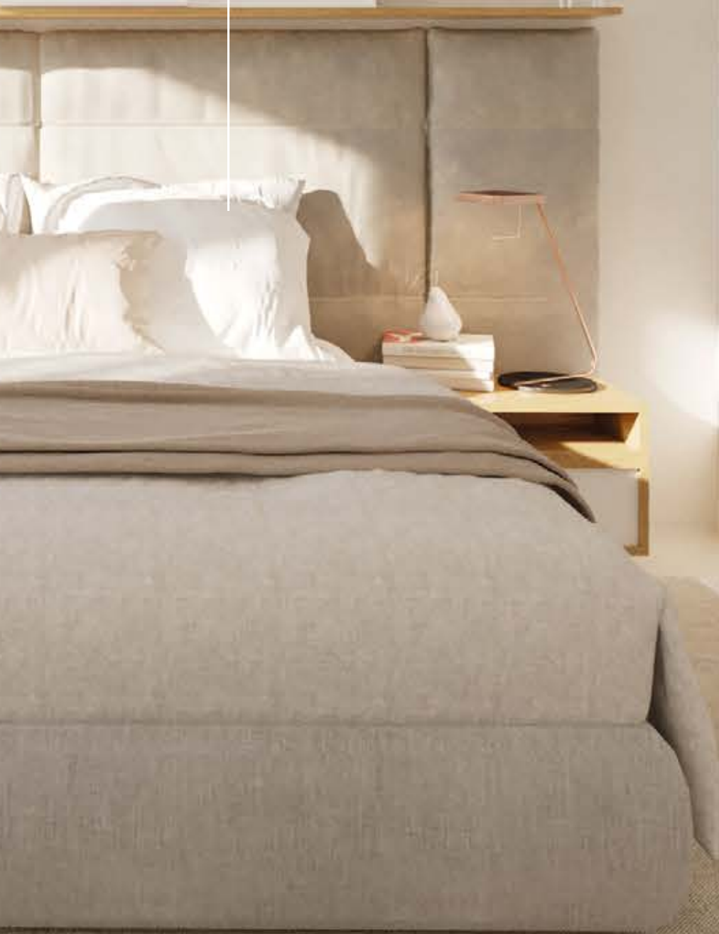
Main bedroom phase 2 type 1-1 / Dormitorio principal fase 2 tipo 1-1