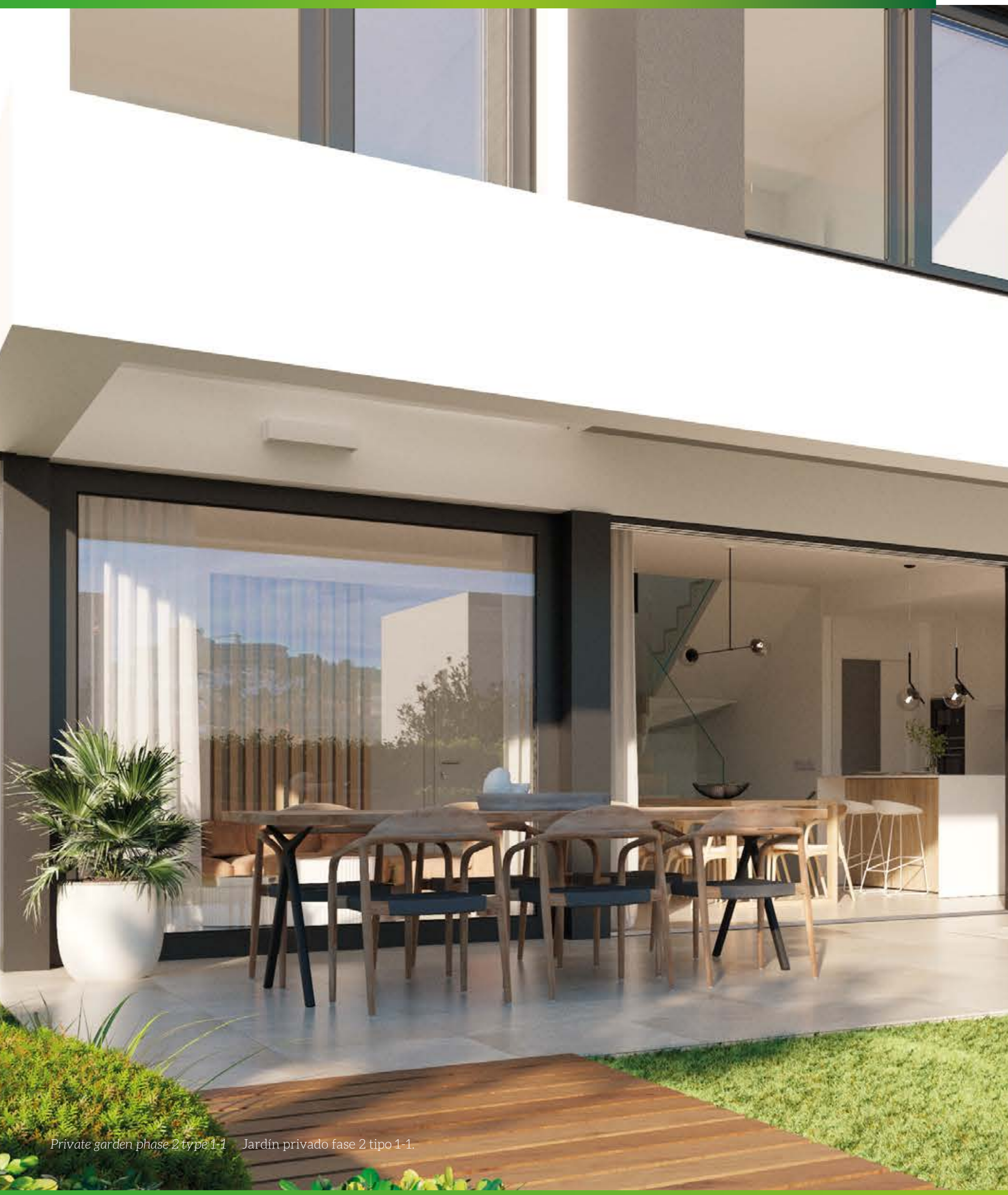
Private garden phase 2 type 1-1 Jardín privado fase 2 tipo 1-1.